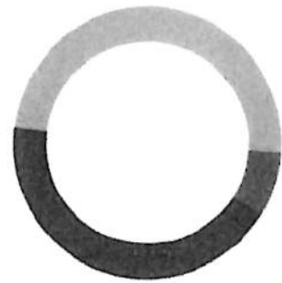
NOMINA BANORTE SIN CHEQUERA (Saldo inicial de $757.14)